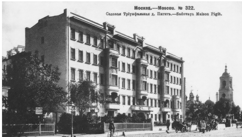
Москва.—Moscou. № 322. Садовая Триумфальная д. Пягитъ.—Sadovaya Maison Pigit.

В 1917-м Пигит переуступил здание Московскому домовладельческому акционерному обществу, которое владело им всего несколько месяцев — до прихода большевиков. При совет-